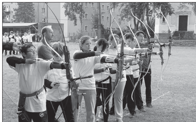
TERČOVNICE BYLY na každý závod opravené (rozstřílená hobra byla vyměněna za novou), na nich zavěšeny nové terče a už se čekalo jen na zahájení závodu rozhodčími.