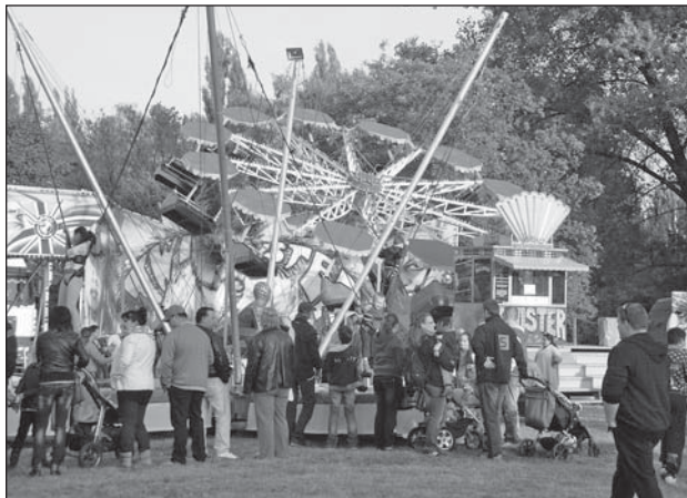
TRADIČNÍ pouťové atrakce přilákaly mnoho návštěvníků.

Program populárního baviče všechny strhl a vyprovokoval k tanci a zpěvu bez ohledu na věk. Lidé se bavili až do večerních hodin, kdy se zábava uzavřela vystoupením skupiny Voxel.