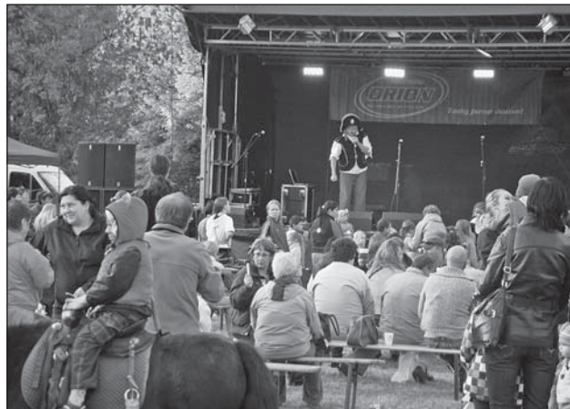
PIRÁTSKÁ SHOW pobavila především ty nejmenší.